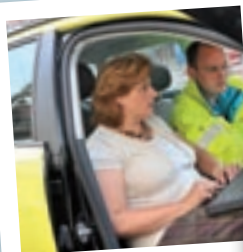
Ofisina di dòkternan na warda