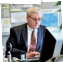
Dòkter di kas